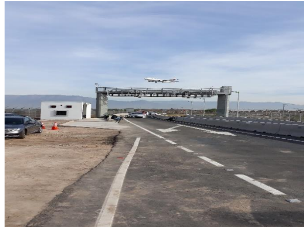
Pórtico sector Portón 12, lado norte

Proyectos de Ingeniería: Estos se encuentran aprobados en un 100%, contando con los planos en versión 0, salvo los ajustes a los requisitos de Accesibilidad Universal de las Pasarelas Cordillera y Volcán Láscar del Tramo B1. El proyecto no presenta avance físico en la actualidad